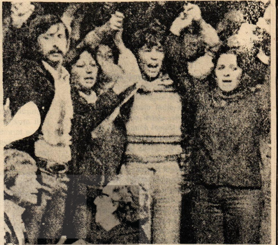
1979 1 Mayıs'ı Şili'de görkemli gösterilerle kutlandı.

Daha sonra seçimlere kadar işbaşında kalmak üzere Eanes tarafından atanan Maria de Lurdes Pintasilgo hükümeti sağcıların eleştirileri ile karşılandı. Öte yandan KP Genel Sekreteri Cunhal Partisi'nin yeni Başbakan karşısında alacağı tavır hükümetin politikası ve programına bağlı olduğunu belirtti. Cunhal, bu ara hükümetin politikasının devrimin kazanımlarını korumak için verilen mücadelenin başarısıyla yakından ilgili olan parlamento seçimlerinin hazırlığı ve seçim sırasında demokratik hak ve özgürlükleri teminat altına alması gerektiğini belirtti.