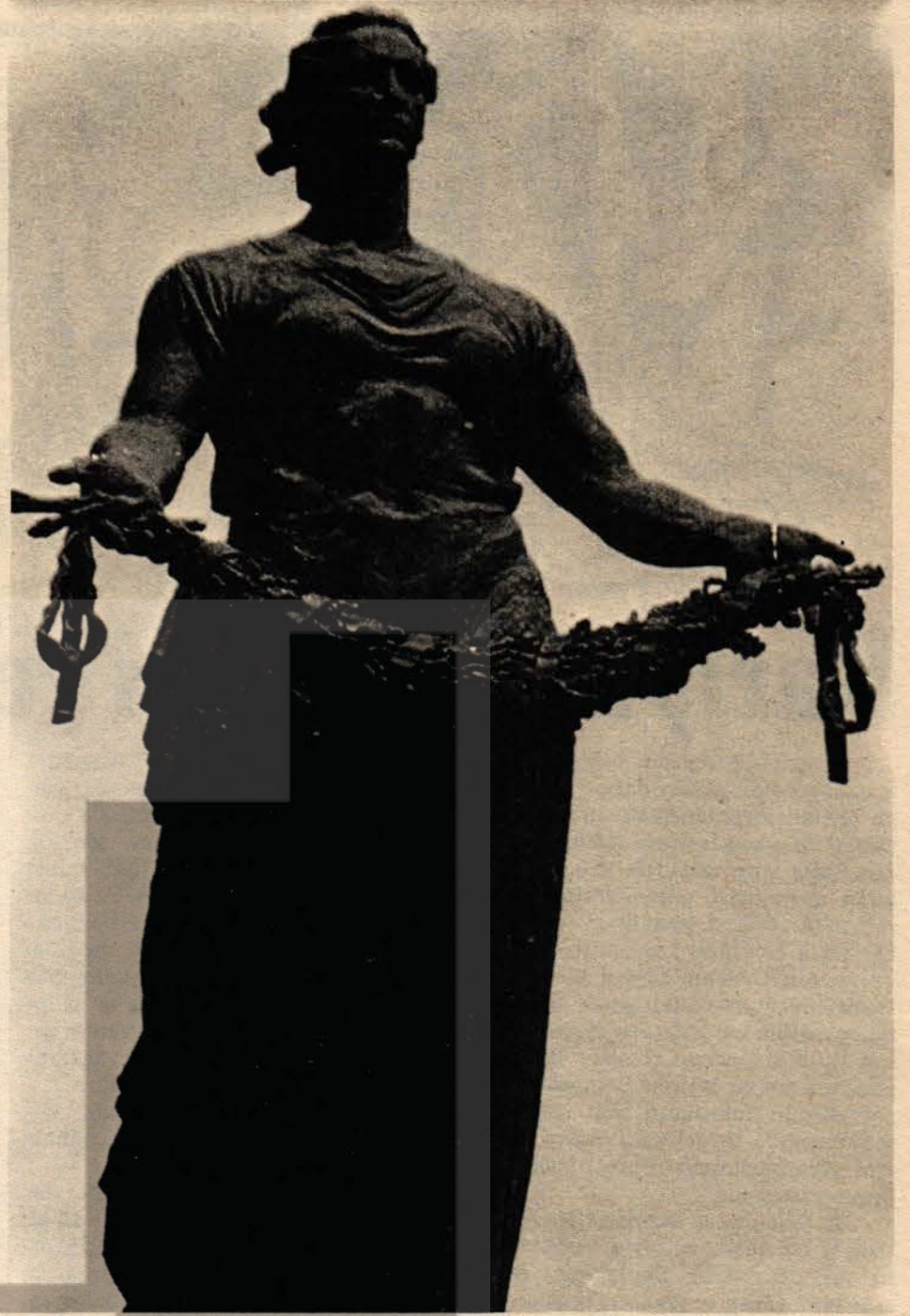
Adsız Kahramanlar Adına Dikilen Zafer Heykeli

Sovyetler Birliğinin «imtiyazlı sınıfı»nın küçük temsilcisi, hoşça kal! «Sosyalizmi»!